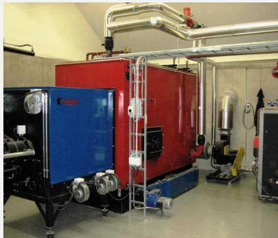
Котел Laka PS 500 кВт с горелкой для щепы компании Biofire

В качестве резервного топлива можно использовать дизельное топливо. Люк дизельной горелки располагается спереди или сбоку. Во время работы котла на твердом топливе горелка поворачивается в сторону.